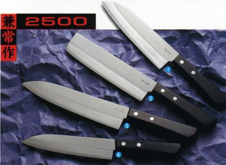
柄/黒合板強化木・刀身/ステンレス本割込・刃厚/1.8mm