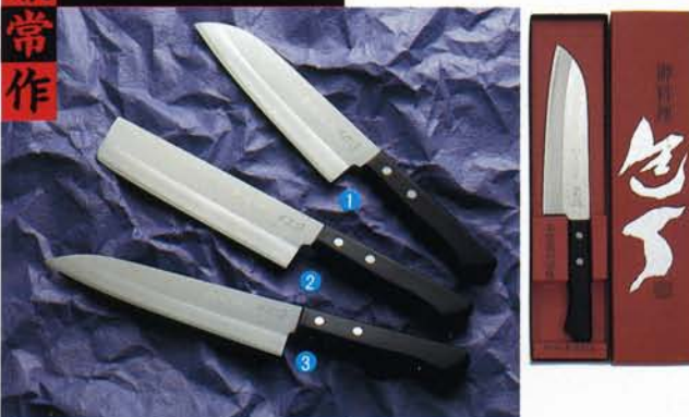
柄/黒合板強化木・刀身/ステンレス本割込D.P・刃厚/1.5mm