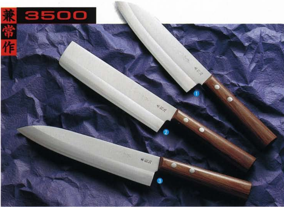
柄/赤合板丸強化木・刀身/ステンレス本割込・刃厚/1.8mm