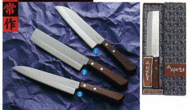
柄/タガヤ天然木・刀身/ステンレス本割込・刃厚/1.5mm