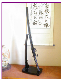
『少年・婦人用刀剣』 AF-45